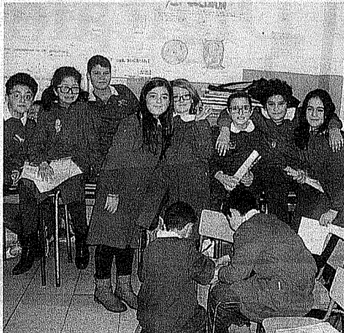
Piccoli lettori a lavoro

La biblioteca comunale "Elena dell' Antoglietta", nel Comune di Fragagnano, offre ai lettori di ogni età vari spazi: una stanza di ingresso, una zona riservata alle librerie colme di libri per ragazzi, una sala dedicata ai bambini più piccoli ed una più ampia, nella quale sono catalogati libri di vario genere. I muri della sala centrale sono splendidamente affrescati con immagini tratte da fiabe famose. Oltre al prestito dei libri, la biblioteca promuove, in collaborazione con la pro-loco, alcune iniziative culturali: "il baratto dei libri" e il progetto "Nati per leggere". Il primo è destinato a lettori di ogni età, il secondo ai bambini fino a 10 anni e consiste nella lettura ad alta voce da parte dei volontari della pro-loco o dei genitori resisi disponibili. Grandi e piccini sono tutti invitati a frequentare spesso la biblioteca per godere del piacere della lettura per viaggiare con la fantasia!