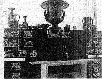
Particolare del Museo

Il museo archeologico e la città vecchia hanno suscitato grande interesse nei piccoli alunni della scuola primaria di Fragagnano. Il 27 marzo i bambini si sono recati a Taranto, tutti insieme, in pullman accompagnati dalle insegnanti. Gli alunni delle classi quinte della scuola primaria "G. Toniolo" hanno manifestato grande curiosità di fronte alle bellezze dei reperti archeologici e naturali della città di Taranto. Il percorso si è dipanato dal "Castello Aragonese" alla Città Vecchia al "Museo Archeologico della Magna Grecia". La pioggerellina di marzo cadeva ininterrottamente, ma non ha fermato la curiosità e la voglia di scoprire delle scolaresche. E' stato coinvolgente esplorare e camminare lungo la via di mezzo che offriva continuamente scorci del Mar Piccolo e del Mar Grande, bellissimo il Duomo di San Cataldo, patrono della città, con tutti i mosaici policromi e le statue in marmo di Giuseppe San Martino, i palazzi nobiliari; l'andron ipogeo, il chiostro dell'Università; le colonne doriche che testimoniano la storia della città. La visita è proseguita nel Museo, dopo aver superato il Ponte Girevole, che, sospeso sul mare Ionio, dava un senso di vertigine; le scolaresche in fila indiana e cappello in testa, trattenuto contro il vento, hanno raggiunto l'ultima tappa. Il Museo ha evocato emo-